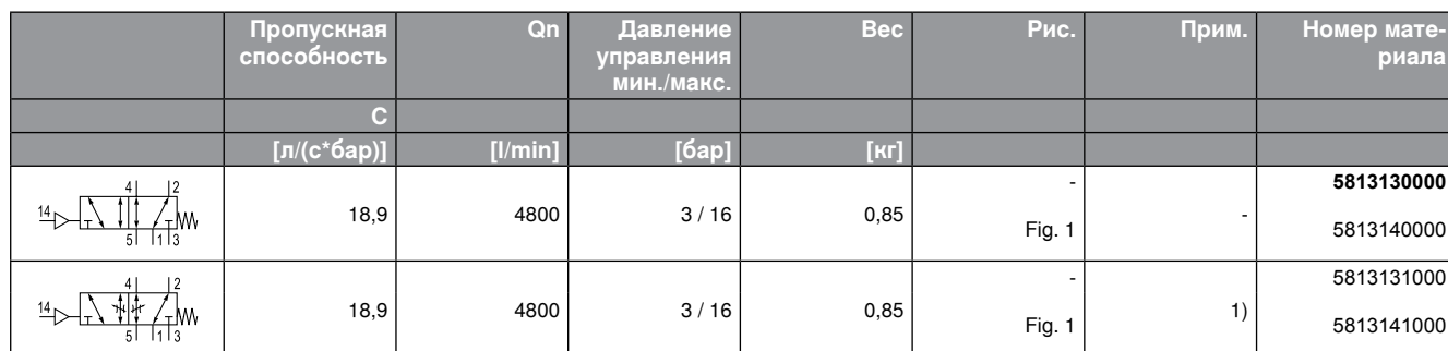
Fig. 1 Крышка клапана, с двумя позициями присоединения, для монтажа модулей логики управления Серия 551.

Может быть создана только одна позиция клапана.